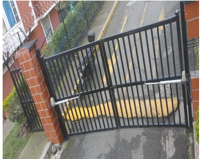
Portería # 2 antigua